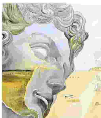
Salvador Dalí a Pisa