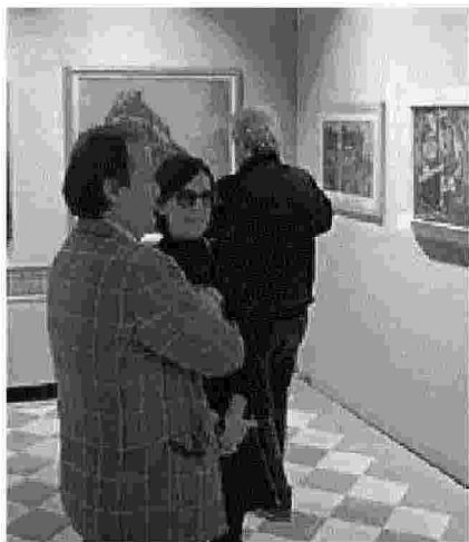
NUOVI SPAZI La mostra al Palp