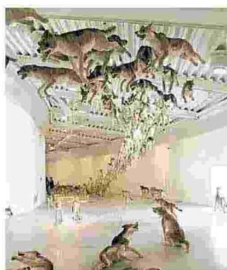
Contemporanei al Pecci di Prato