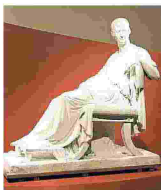
Marmi e gessi a Carrara