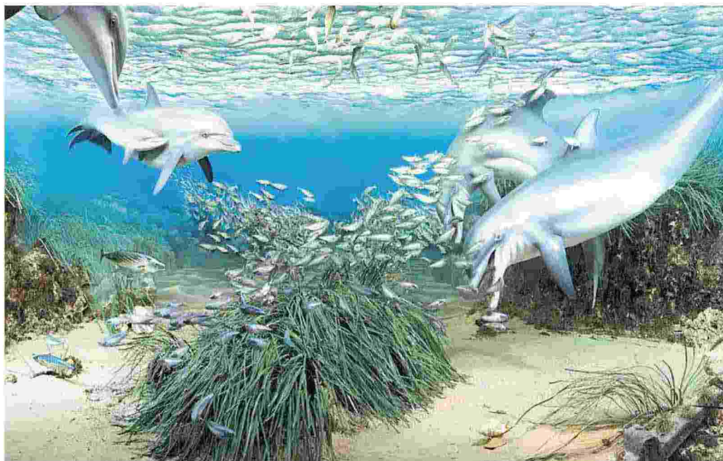
La mostra "Abissi" al Museo di storia naturale del Mediterraneo a Livorno